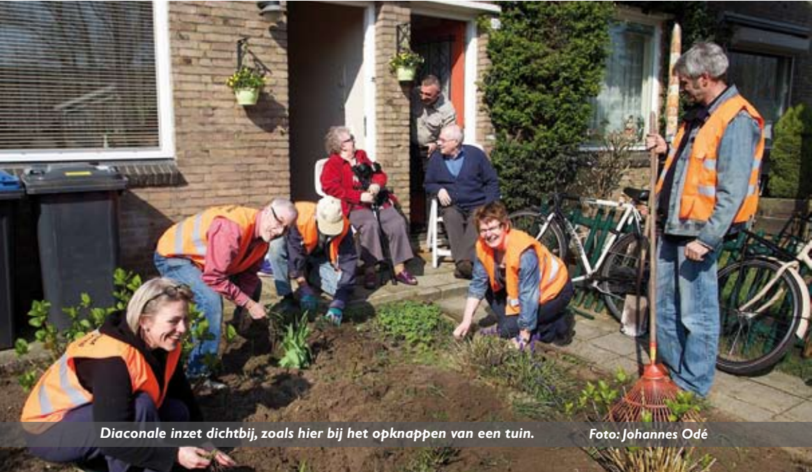
Diaconale inzet dichtbij, zoals hier bij het opknappen van een tuin.