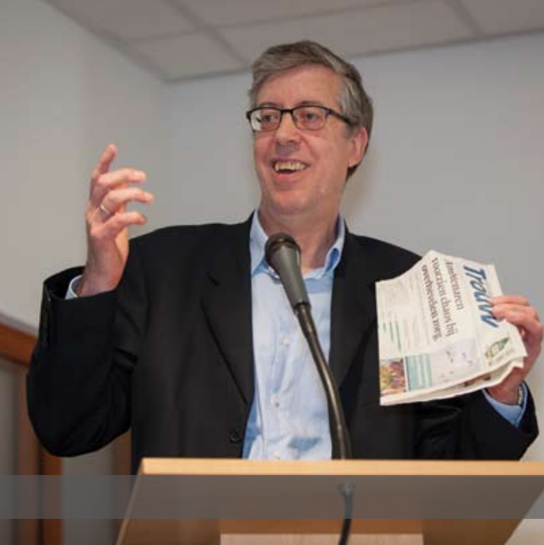
Foto links: Circa 120 belangstellenden bezoeken de studiedag Kerken en WMO, georganiseerd door Kerk in Actie en de Federatie van Diaconieën aan de vooravond van de ingrijpende wijzigingen in de zorg per 2015.